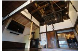
Yoshitake村 淡路 ▲

弊社は2018年に淡路島の古民家を購入し、自社の企業保養所として使用する為古民家フルリノベーションを行いました。その際のノウハウを活かし、この度個人様向けの古民家再生プロジェクトを始動することとなりました!